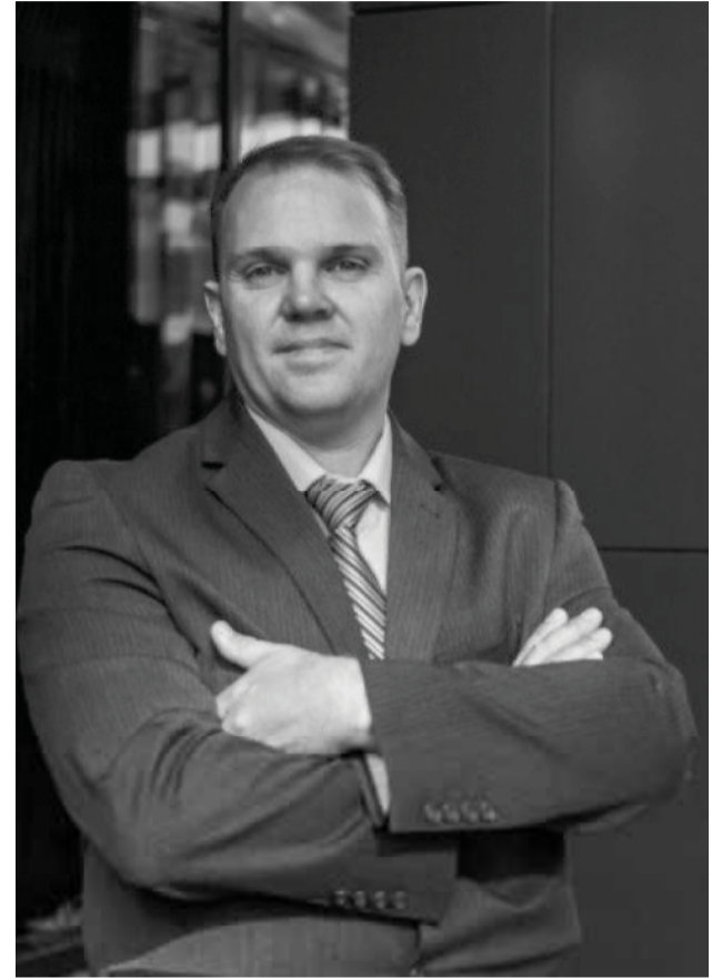
Калининградской областью России. В настоящее время по этой территории проходит граница Польши с Литвой.

Сувальский коридор СПРАВКА Сувальский коридор (польск. Przesmyk suwalski; в американской военной терминологии «коридор СК») — гипотетический сухопутный «коридор» длиной около 100 километров, который мог бы соединить территорию Белоруссии с