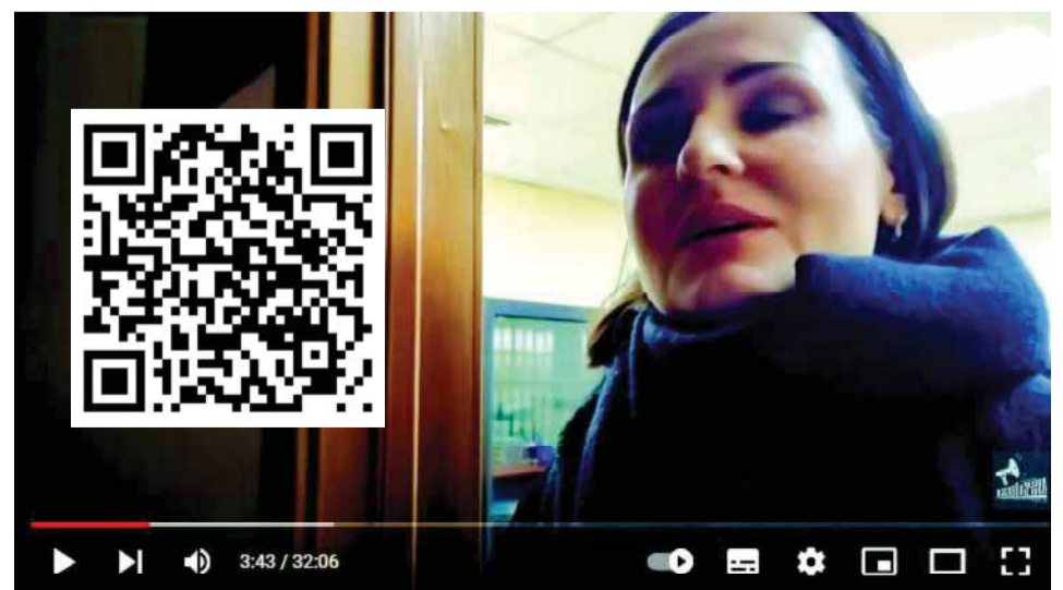
Депутат Буцкая СБЕЖАЛА от Совета Матерей и Жен!