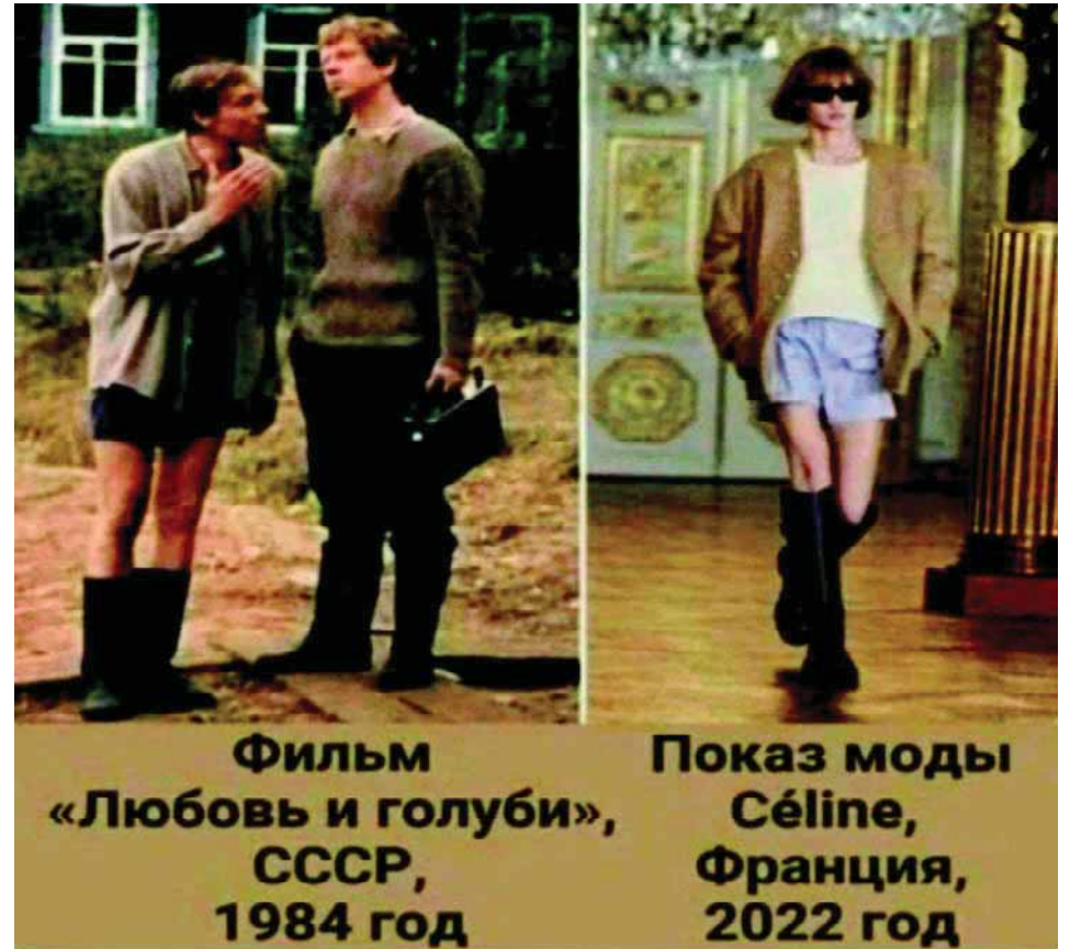
Фильм «Любовь и голуби», СССР, 1984 год

фактическое 16.02.2023 11:00. Тираж: 5000 Ответственность за содержание и достоверность публикаций несут авторы. Мнение редакции может не совпадать с мнением авторов. В публикациях сохраняется авторский стиль и орфография. Правом редакции является правка и сокращение текстов. Рукописи принимаются только в электронном виде на адрес эл. почты e-mail: hochyvssr2@mail.ru . Т.к. газета создана на общественных началах, гонорары в ней отсутствуют. Написание газеты: «Хочу в СССР-2», «Хочу в СССР!», «Хочу в СССР!» считать равнозначными.